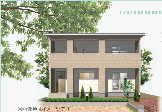
※画像類はイメージです